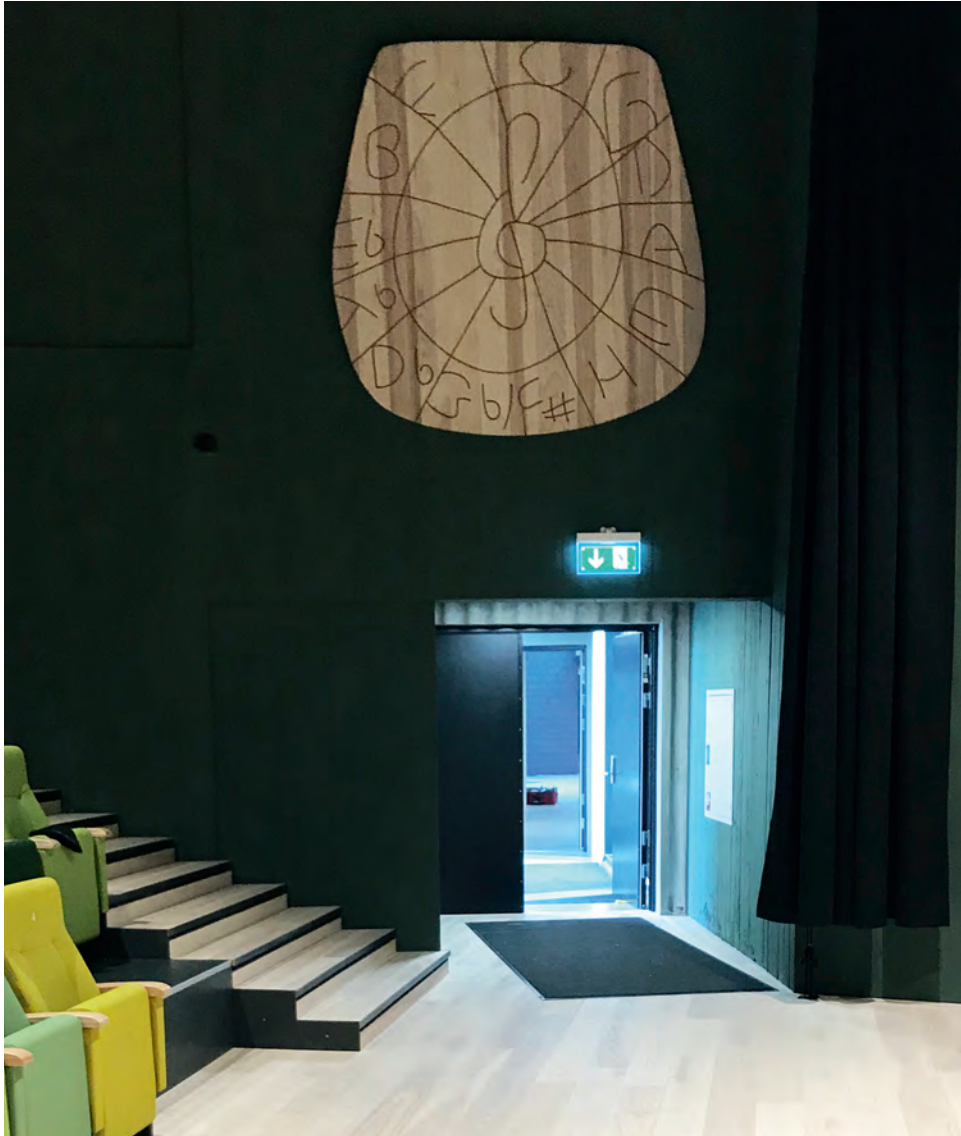
Kvintsirkul í Hátúni