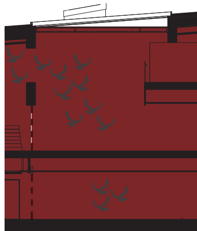
Tinnuveggur við hövuðsinngongd