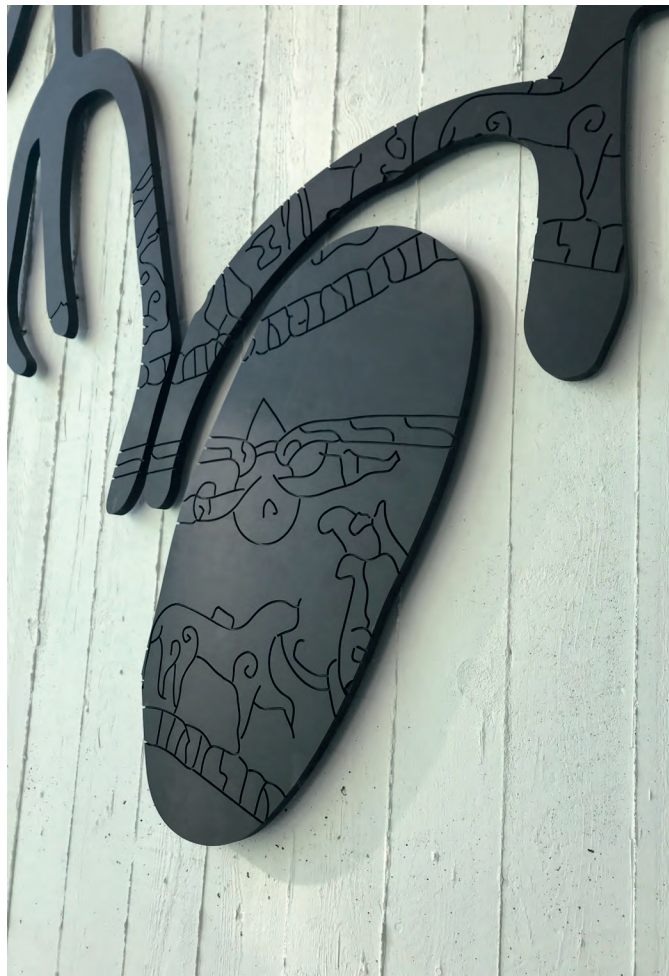
Myndir av Gjónni