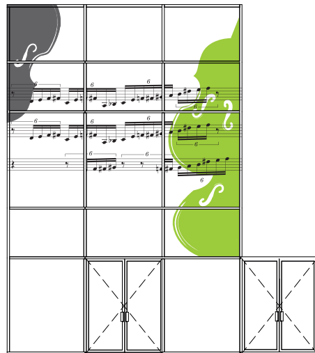
Glasfasada við terrassuinnngongd Sunleif Rasmussen Nótadæmi úr “Oceanic Days”, 1995, Symfoni, VL1, frá takt 104