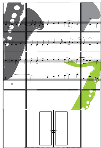
Glasfasada við bakinnngongd Ólavur Jøkladal Nótadæmi úr "Sum hjörtur hyggur", fleirraddað kórverk, sálmur 42, 1985