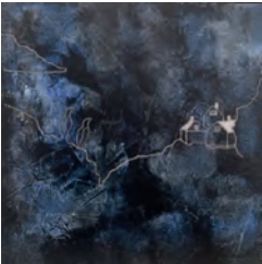
Ovasta hædd í Tinnu