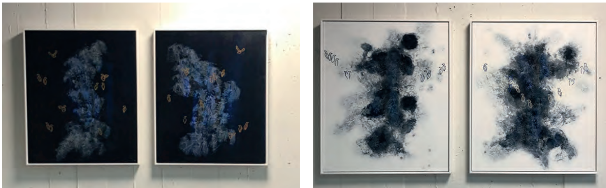
Bíðirúm við terrassuinngond